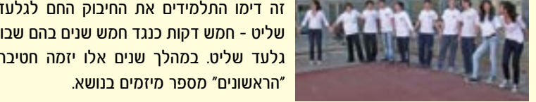
תלמידי חטיבת הביניים "הראשונים" יצרו מעגל בית ספרי ענק "וחיבקו" את ביה"ס. בחיבוק זה דימו התלמידים את החיבוק החם לגלעד שליט - חמש דקות כנגד חמש שנים בהם שבו גלעד שליט. במהלך שנים אלו יזמה חטיבת "הראשונים" מספר מיזמים בנושא.